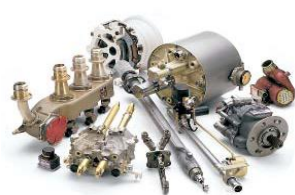
Системы и оборудование для аэрокосмической отрасли