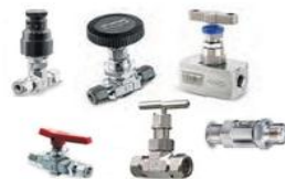
Клапаны – игольчатые, дозировочные, шаровые, обратные ...