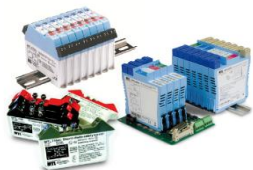
Искробезопасные интерфейсы и системы

MTL Instruments производит весь спектр искробезопасного оборудования для применения в системах автоматизации технологических процессов.