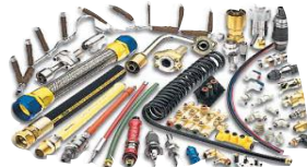
Гидравлические соединения устройства для пневмо- и гидросистем