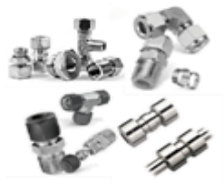
Фитинги A-Lok, CPI, Phastie, Ermeto ...

Конструктивные решения, предлагаемые Parker Hannifin для разных технологических задач и условий эксплуатации, а также широчайшая номенклатура изделий, обеспечивает реализацию практически любой технической задачи, от простейшего механического соединения до создания сложной многокомпонентной системы гидравлического управления.