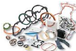
Устройства уплотнения и герметизации