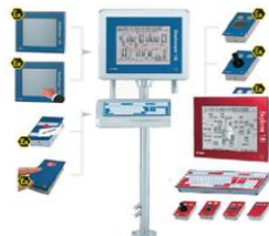
Взрывозащищённые компьютерные терминалы