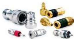
Прецизионные соединения быстроразъёмного типа (БРС)...