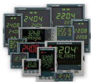
Промышленные одно- и многоконтурные температурные контроллеры

Eurotherm имеет репутацию надежного производителя решений для управления и автоматизации, позволяющих достичь ощутимого уровня экономии инвестиционных вложений, путем минимизации используемых временных, финансовых и людских ресурсов.