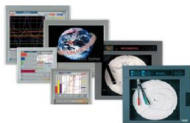
Промышленные бумажные и безбумажные самописцы