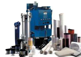
Фильтры, фильтроэлементы, системы фильтрации