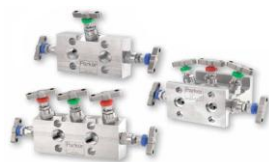
Манифолды - 2-х вентильные, 3-х вентильные, 5-ти вентильные ...