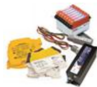
Устройства защиты от импульсных перенапряжений