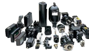
Гидравлические системы и компоненты