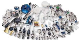
Инструментальная арматура для КИП устройства контроля и коммутации потока