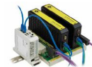
Промышленные модули безопасности TOFINO