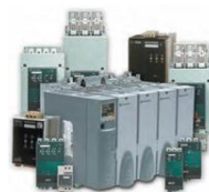
Тиристоры и реле для силовых электрических сетей