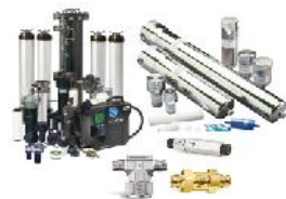
Фильтры для КИП, газовые, топливные, гидравлические фильтры ...