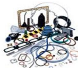
Уплотнения и герметизация промышленные и коммерческие уплотнения