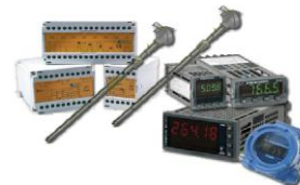
Измерительная аппаратура и устройства обработки сигналов