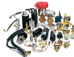
Климатическое и промышленное оборудование