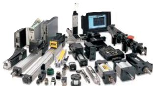
Пневматические и электромеханические устройства для автоматизации