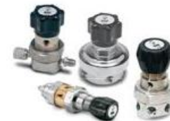
Регуляторы давления для различных применений ...