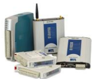
Беспроводные решения MTL для применения в автоматизации