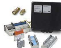
Компоненты систем Fieldbus