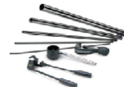
Трубы и трубомонтажное оборудование ...